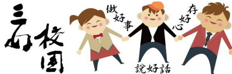
圖 1：普門中學學生圖像、校本素養指標與優質化課程發展目標示意圖